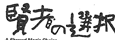
A Shrewd Man's Choice