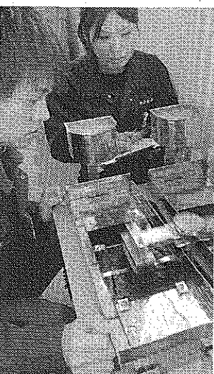
コーティング剤の性能を調べる社員