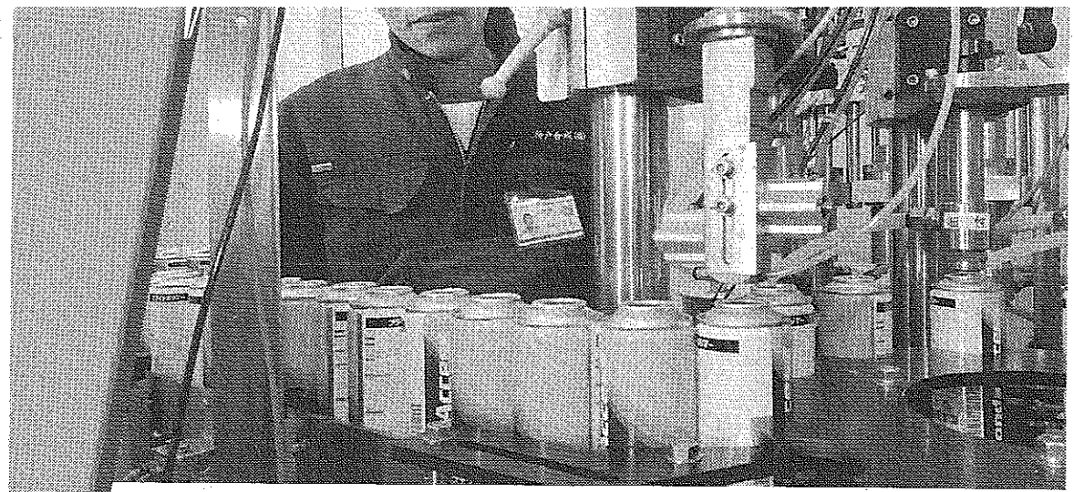
次々と製造される自動車・二輪車向けのコーティング剤。傍らで社員が厳しい目を光らせる