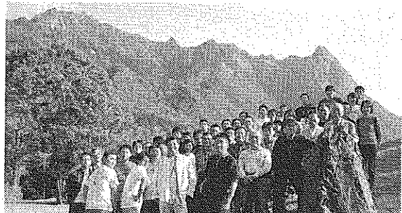
屋久島への社員慰安旅行。最近、世界遺産を訪ねている